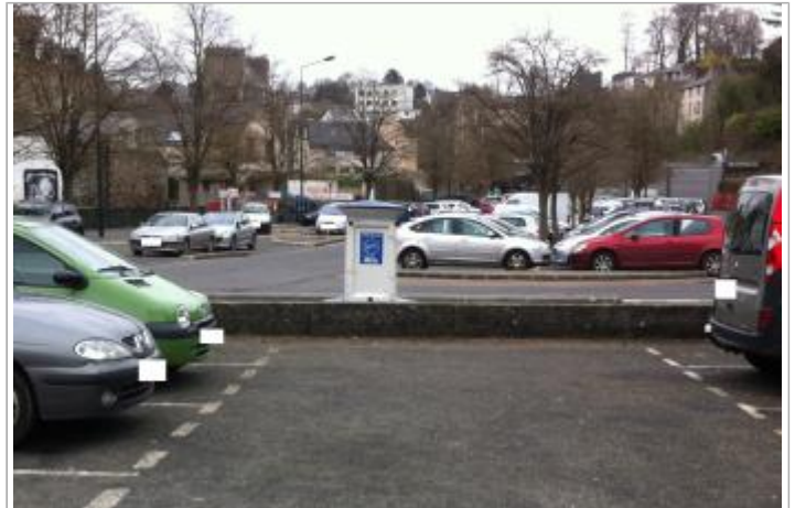
Parking supermarché Rue de Brest