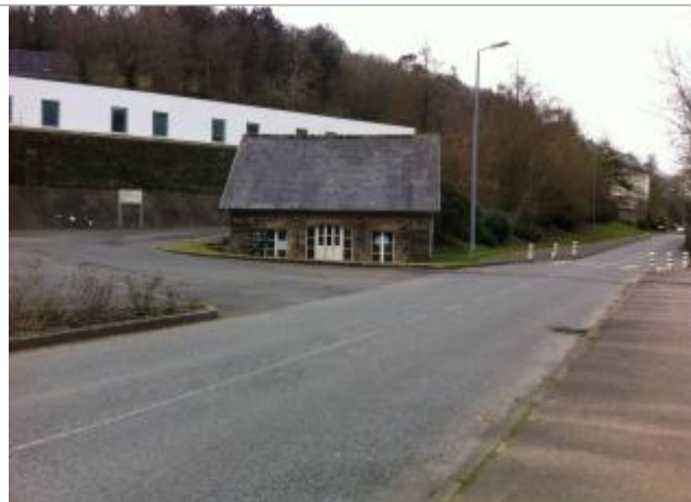
Bâtiment du centre hospitalier coté Queffleuth