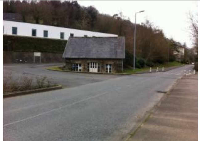
Bâtiment du centre hospitalier coté Queffleuth

Coordonnées WGS84 : X: -3.83321210 / Y: 48.57307000