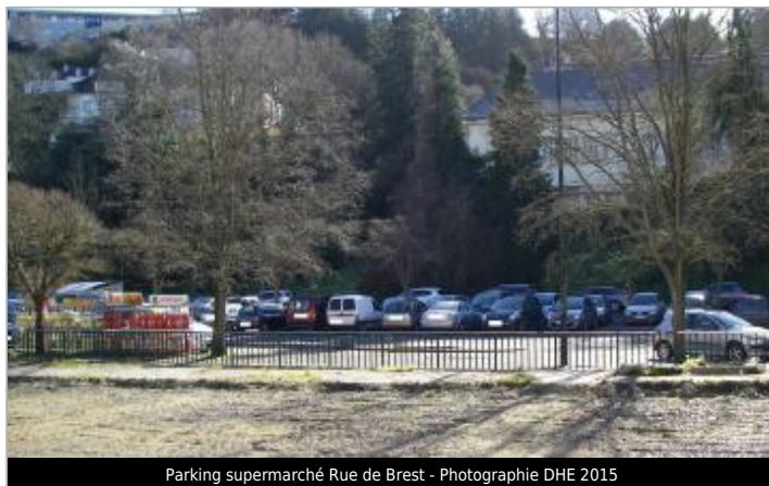
Parking supermarché Rue de Brest - Photographie DHE 2015