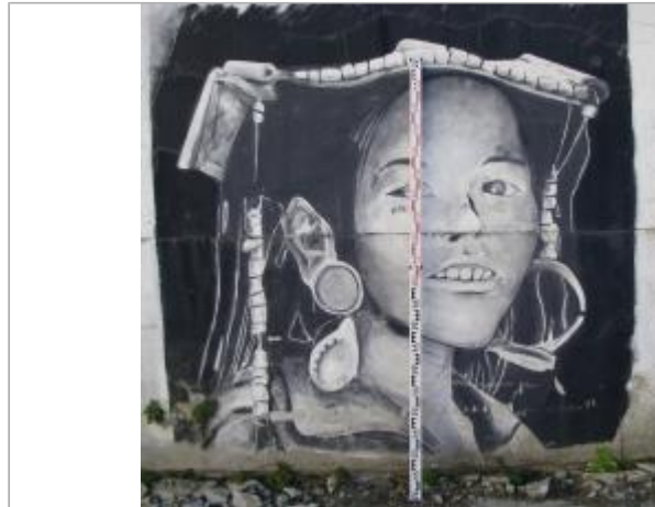
Mur recouvert d'une peinture au 60 rue de Brest

Coordonnées WGS84 : X: -3.83109210 / Y: 48.57459600