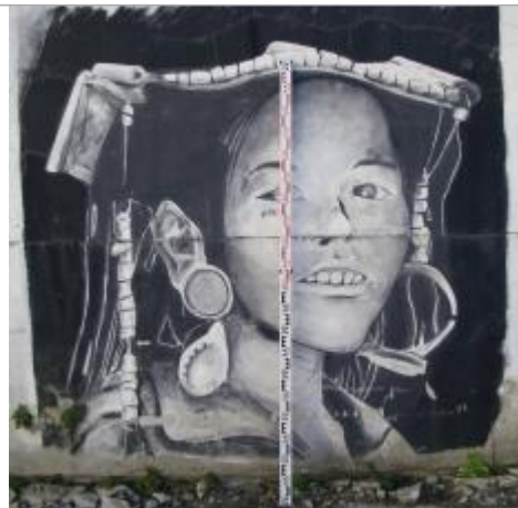
Mur recouvert d'une peinture au 60 rue de Brest