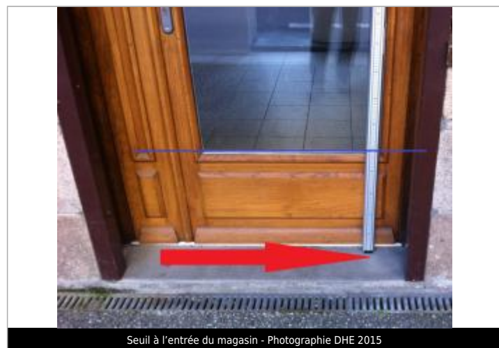
Seuil à l'entrée du magasin