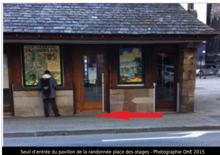
Seuil d'entrée du pavillon de la randonnée place des otages