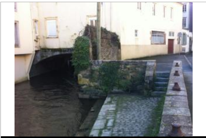
Marches d'accès au quai allée Poan Ben au niveau du musée des jacobins

GÉOLOCALISATION Coordonnées WGS84 : X: -3.82473160 / Y: 48.57643800 Coordonnées RGF93 (Lambert 93) X: 197178.28 / Y: 6852434.47 Coordonnées RGF93 (ETRS89) : X: -3.8247316 / Y: 48.576438 Code Hydro: J26-0300 Rive de référence: Droite