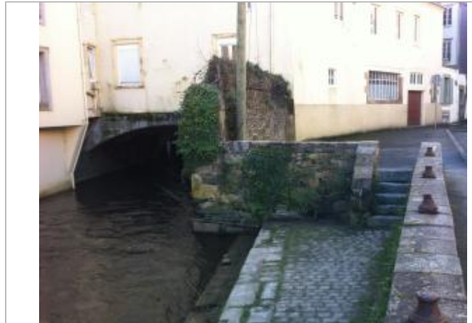
Marches d'accès au quai allée Poan Ben au niveau du musée des jacobins