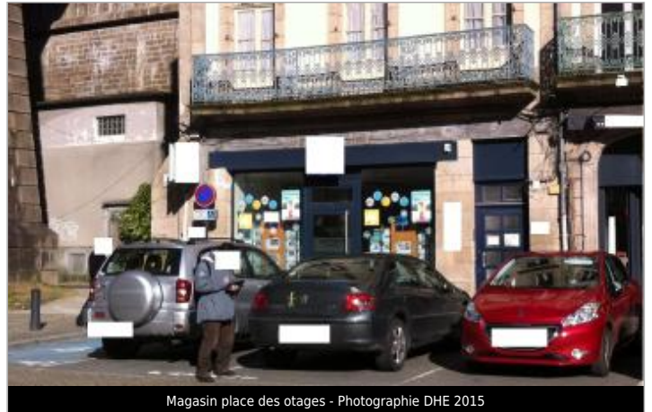
Magasin place des otages