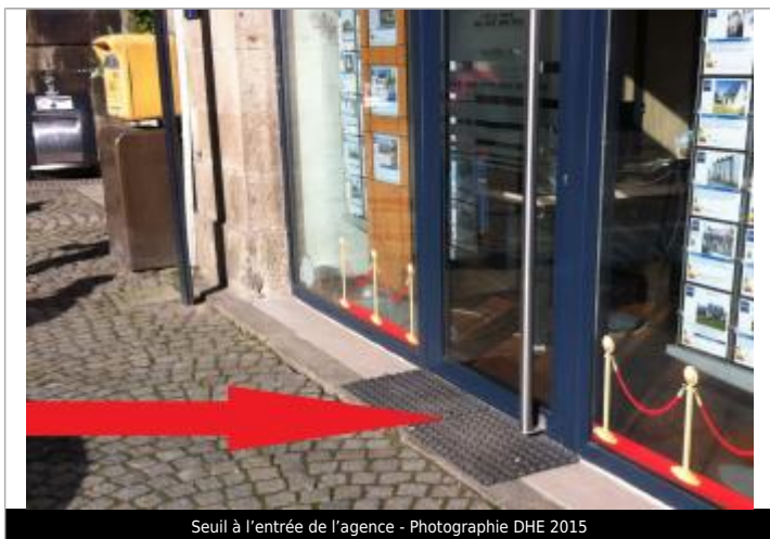
Seuil à l'entrée de l'agence

Altitude calculée de l'eau (en m) : 5.68 m