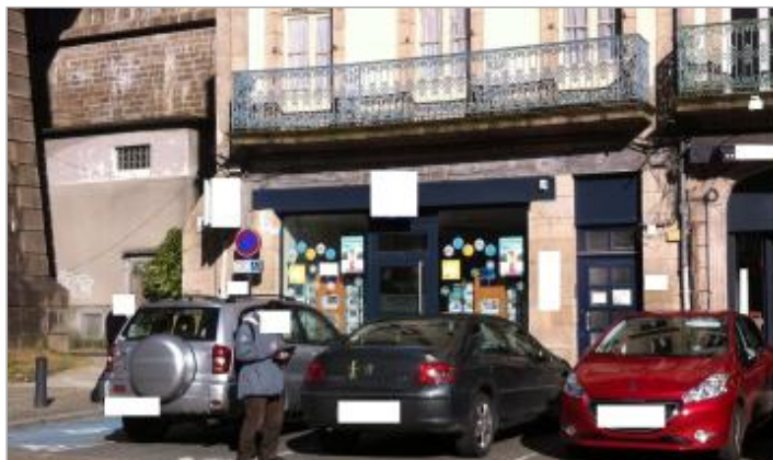
Magasin place des otages - Photographie DHE 2015