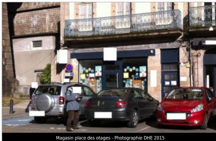
Magasin place des otages - Photographie DHE 2015