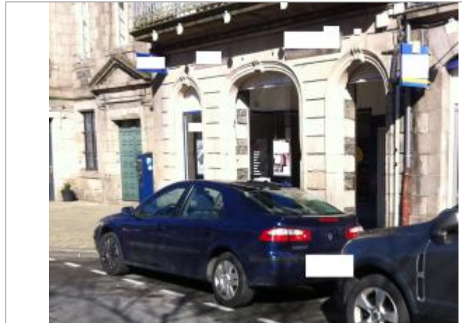
Bâtiment place Cornic - Photographie DHE 2015