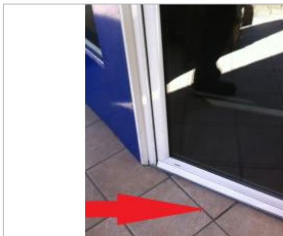
Sol à l'extérieur de la porte d'entrée de l'agence