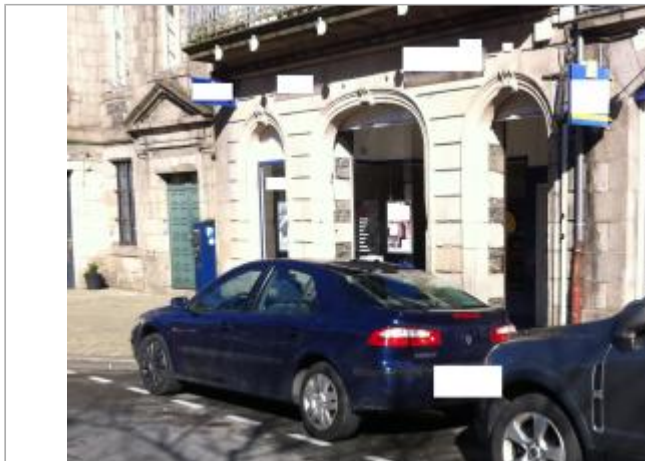
Bâtiment place Cornic - Photographie DHE 2015