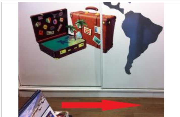
Sol à l'intérieur du magasin