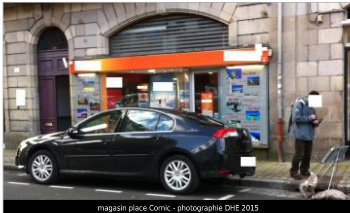
magasin place Pornic - photographie DHE 2015