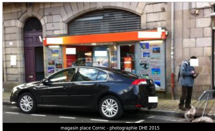
magasin place Cornic

GÉOLOCALISATION Coordonnées WGS84 : X: -3.82999780 / Y: 48.57923000 Coordonnées RGF93 (Lambert 93) X: 196818.06 / Y: 6852777.24 Coordonnées RGF93 (ETRS89) : X: -3.8299978 / Y: 48.57923 Code Hydro: J2614000 Rive de référence: Gauche