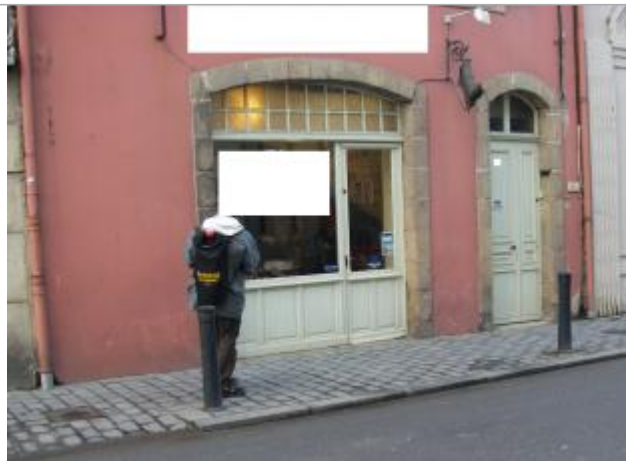
Cordonnerie rue de Brest

Coordonnées WGS84 : X: -3.82887670 / Y: 48.57598700