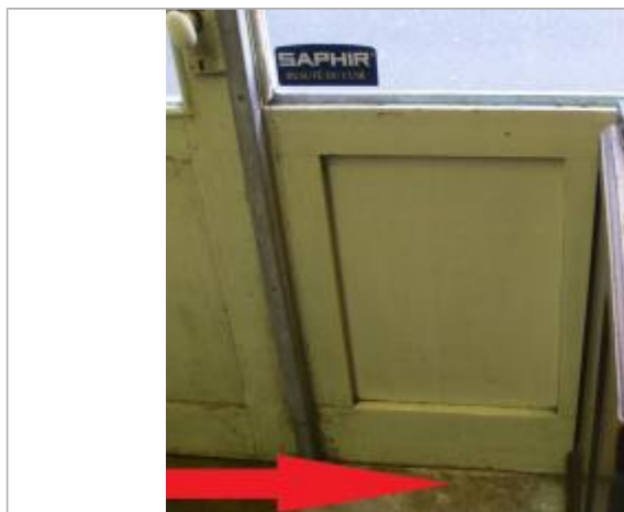
porte du magasin seuil intérieur

Altitude calculée de l'eau (en m) : 8.54 m