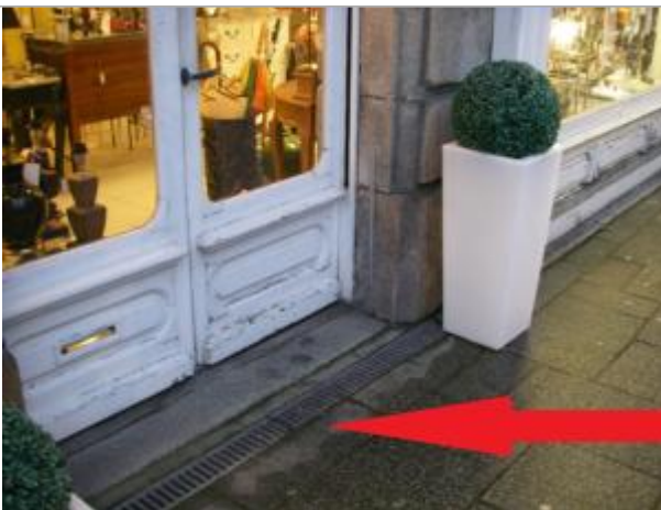
Trottoir devant la porte d'entrée du magasin

Altitude calculée de l'eau (en m) : 6.52 m