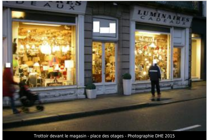
Trottoir devant le magasin - place des otages