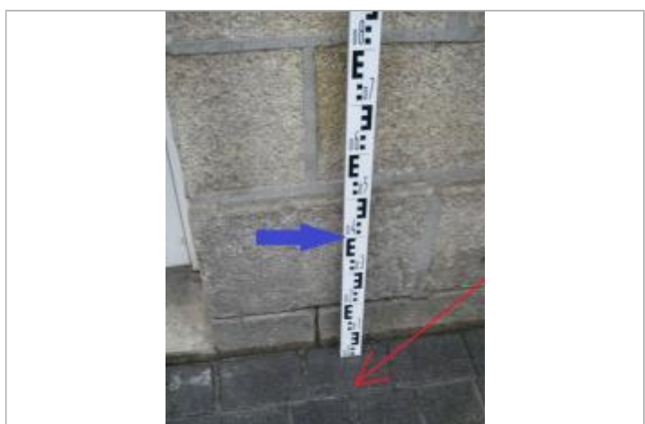
Trottoir à droite de la porte d'entrée

MARQUE Maximum de l'inondation : Non Visibilité : Oui État du repère : Moyen Pérennité : Aucune Repère calculé : Non PHEC : Non