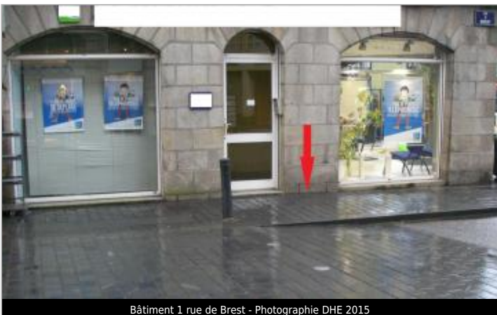
Bâtiment 1 rue de Brest

GÉOLOCALISATION Coordonnées WGS84 : X: -3.82817130 / Y: 48.57691000 Coordonnées RGF93 (Lambert 93) X: 196930.02 / Y: 6852508.65 Coordonnées RGF93 (ETRS89) : X: -3.8281713 / Y: 48.57691 Code Hydro: J2614000 Rive de référence: Gauche