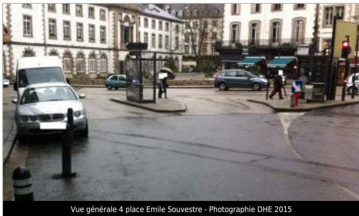
Vue générale 4 place Emile Souvestre - Photographie DHE 2015

GÉOLOCALISATION Coordonnées WGS84 : X: -3.82849710 / Y: 48.57706800 Coordonnées RGF93 (Lambert 93) X: 196907.59 / Y: 6852528.23 Coordonnées RGF93 (ETRS89) : X: -3.8284971 / Y: 48.577068 Code Hydro: J2614000 Rive de référence: Gauche