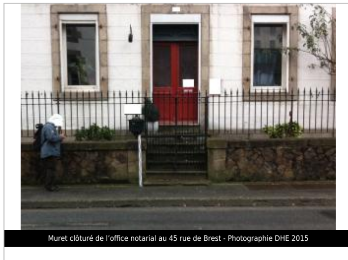
Muret clôturé de l'office notarial au 45 rue de Brest