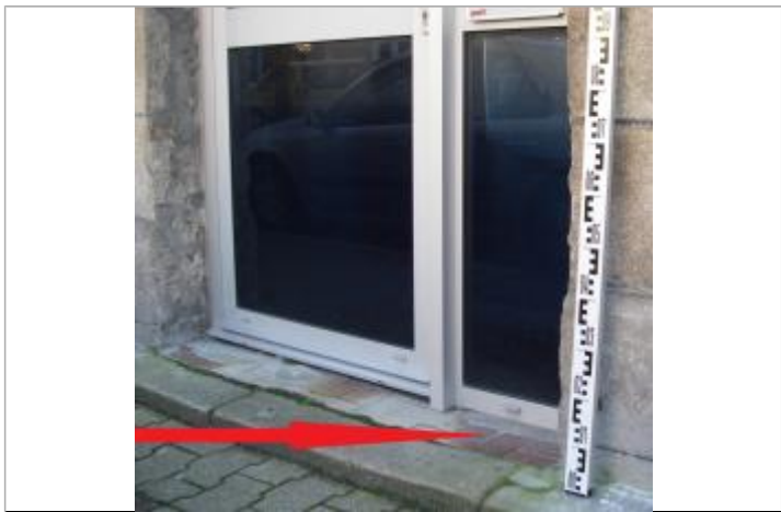
Seuil à l'entrée de l'agence

MARQUE Maximum de l'inondation : Oui Visibilité : Oui État du repère : Moyen Pérennité : Aucune Repère calculé : Non PHÉC : Non