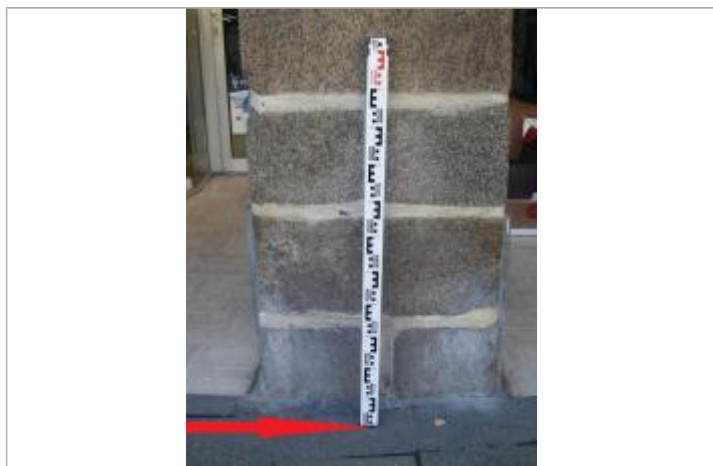
Seuil à l'entrée du magasin au niveau du pilier