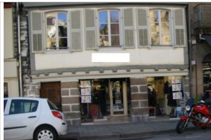
Magasin 23 Place des otages - Photographie DHE 2015