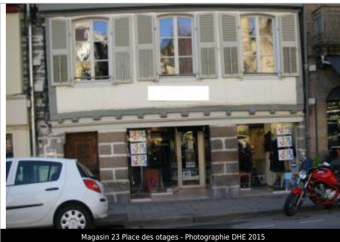
Magasin 23 Place des otages - Photographie DHE 2015