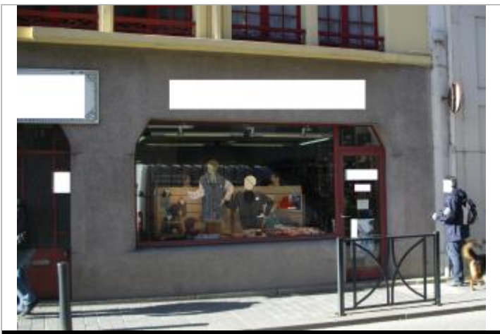
Magasin 13 Rue de Brest - Photographie DHE 2015

GÉOLOCALISATION Coordonnées WGS84 : X: -3.82845040 / Y: 48.57653300 Coordonnées RGF93 (Lambert 93) X: 196905.89 / Y: 6852468.68 Coordonnées RGF93 (ETRS89) : X: -3.8284504 / Y: 48.576533 Code Hydro: J2614000 Rive de référence: Gauche