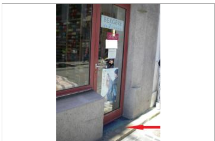
Seuil de la porte d'entrée du magasin

MARQUE Maximum de l'inondation : Oui Visibilité : Oui État du repère : Moyen Pérennité : Aucune Repère calculé : Non PHÉC : Non