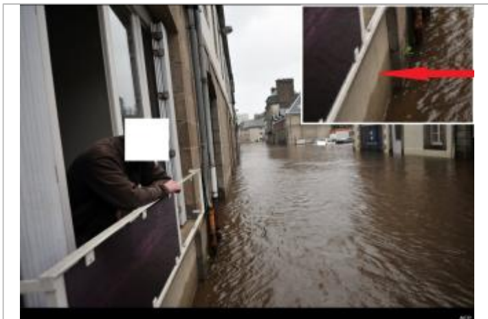
laisse de crue sous la fenêtre du 59 rue de Brest. Heure de prise de vue inconnue

Altitude calculée de l'eau (en m) : 8.74