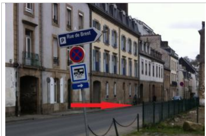
A proximité du 59 rue de Brest

GÉOLOCALISATION Coordonnées WGS84 : X: -3.83117780 / Y: 48.57479500 Coordonnées RGF93 (Lambert 93) X: 196688.75 / Y: 6852293.57 Coordonnées RGF93 (ETRS89) : X: -3.8311778 / Y: 48.574795 Code Hydro: J2614000 Rive de référence: Gauche