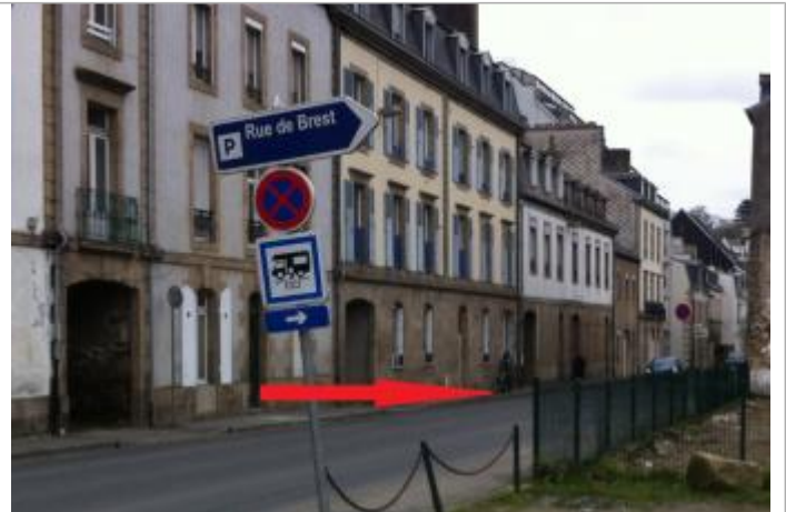
A proximité du 59 rue de Brest

Coordonnées WGS84 : X: -3.83117780 / Y: 48.57479500