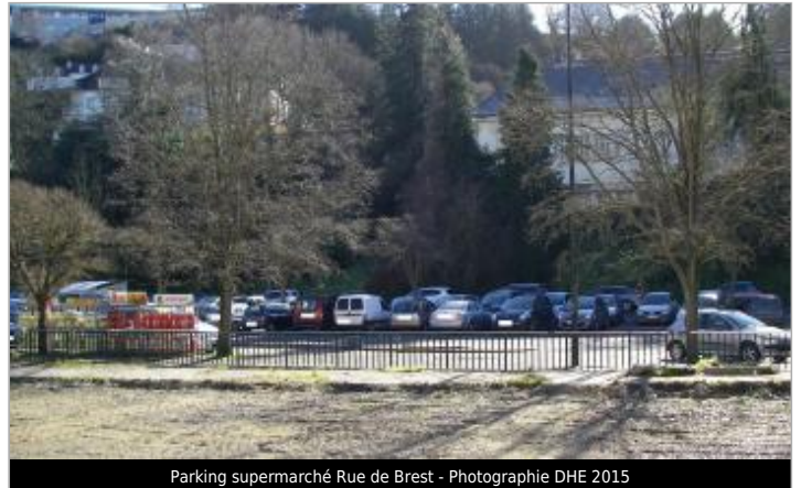
Parking supermarché Rue de Brest - Photographie DHE 2015