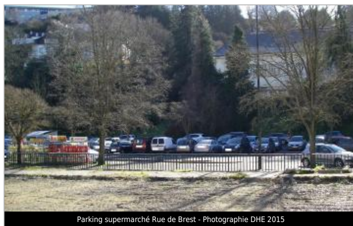
Parking supermarché Rue de Brest

GÉOLOCALISATION Coordonnées WGS84 : X: -3.83125900 / Y: 48.57441400 Coordonnées RGF93 (Lambert 93) X: 196679.12 / Y: 6852251.89 Coordonnées RGF93 (ETRS89) : X: -3.831259 / Y: 48.574414 Code Hydro: J2614000 Rive de référence: Droite