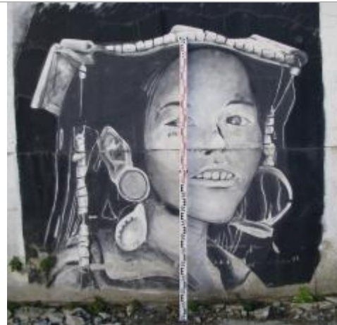
Mur recouvert d'une peinture au 60 rue de Brest