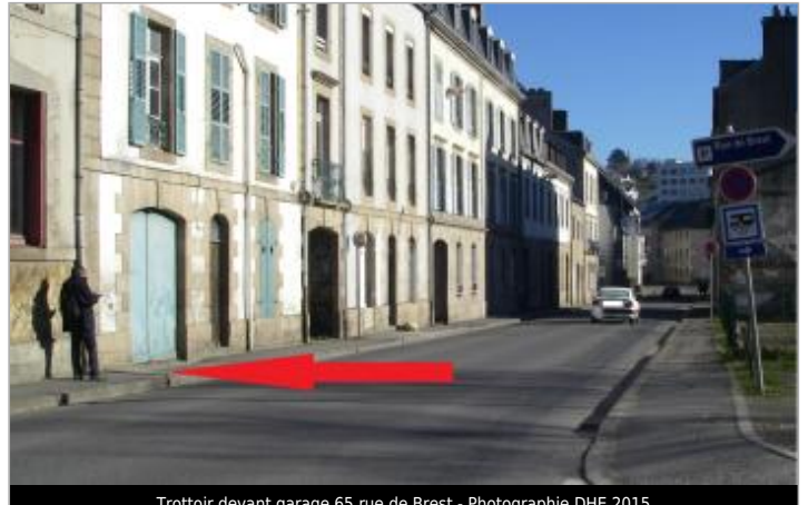
Trottoir devant garage 65 rue de Brest