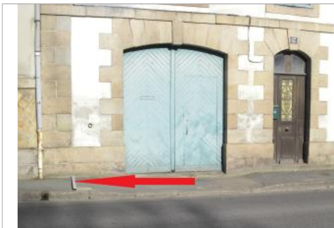
Indication (flèche) de la limite de l'inondation sur le trottoir

Altitude calculée de l'eau (en m) : 8.67