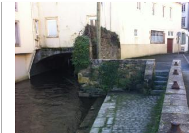
Marches d'accès au quai allée Poan Ben au niveau du musée des jacobins