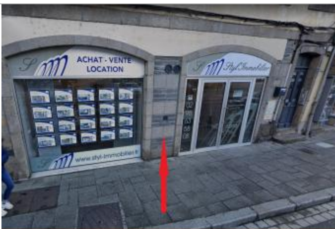
Agence immobilière 13 place des otages

Altitude calculée de l'eau (en m) : 6.21