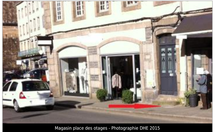
Magasin place des otages - Photographie DHE 2015