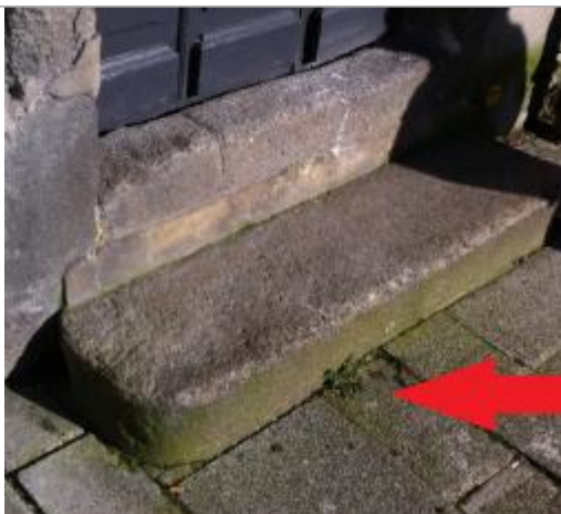
Marches à l'entrée du magasin

Altitude calculée de l'eau (en m) : 5.82