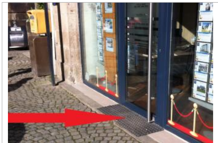
Seuil à l'entrée de l'agence

Altitude calculée de l'eau (en m) : 5.68