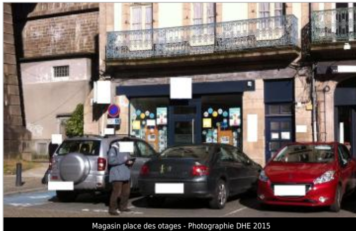
Magasin place des otages