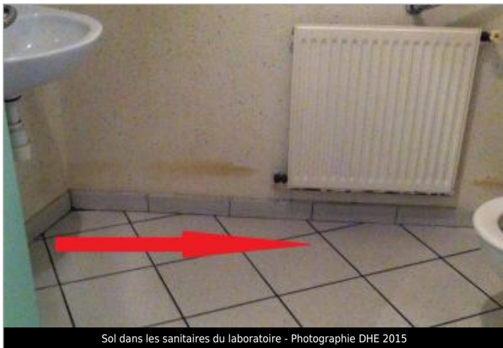
Sol dans les sanitaires du laboratoire - Photographie DHE 2015