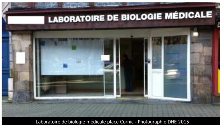
Laboratoire de biologie médicale place Cornic