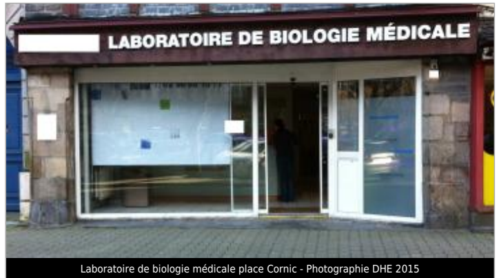
Laboratoire de biologie médicale place Cornic

Coordonnées WGS84 : X: -3.82913430 / Y: 48.57953200