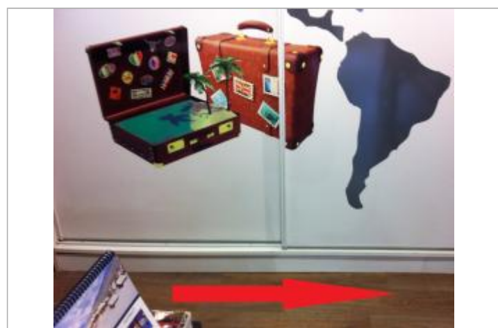
Sol à l'intérieur du magasin

GÉNÉRAL Code : DHE2015MO_R_22_01 Date de mise à jour : 23/09/2019 Auteur : SPC VCB