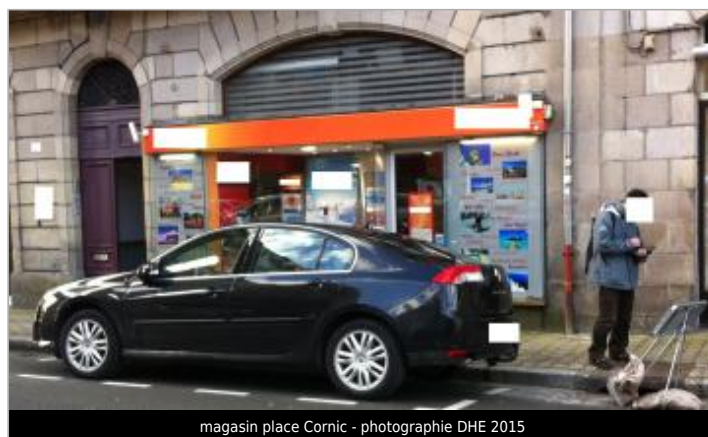
magasin place Cornic - photographie DHE 2015

GÉOLOCALISATION Coordonnées WGS84 : X: -3.82999780 / Y: 48.57923000 Coordonnées RGF93 (Lambert 93) X: 196818.06 / Y: 6852777.24 Coordonnées RGF93 (ETRS89) : X: -3.8299978 / Y: 48.57923 Code Hydro: J2614000 Rive de référence: Gauche