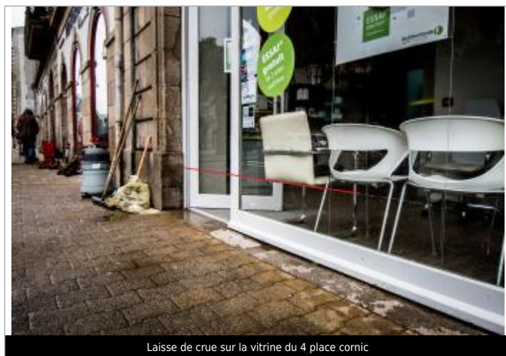
Laisse de crue sur la vitrine du 4 place cornic

Altitude calculée de l'eau (en m) : 5.96