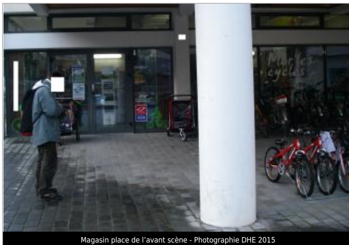
Magasin place de l'avant scène