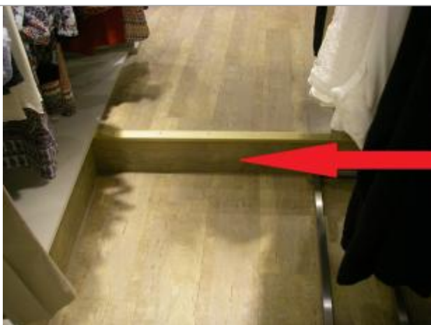
Rez-de-chaussée du magasin au niveau de la plinthe

Différence entre le niveau d'eau et la référence (en m) : 0.170 m