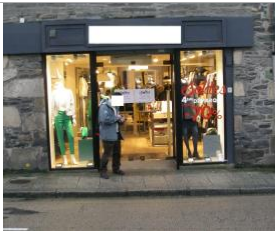
Magasin rue de Brest