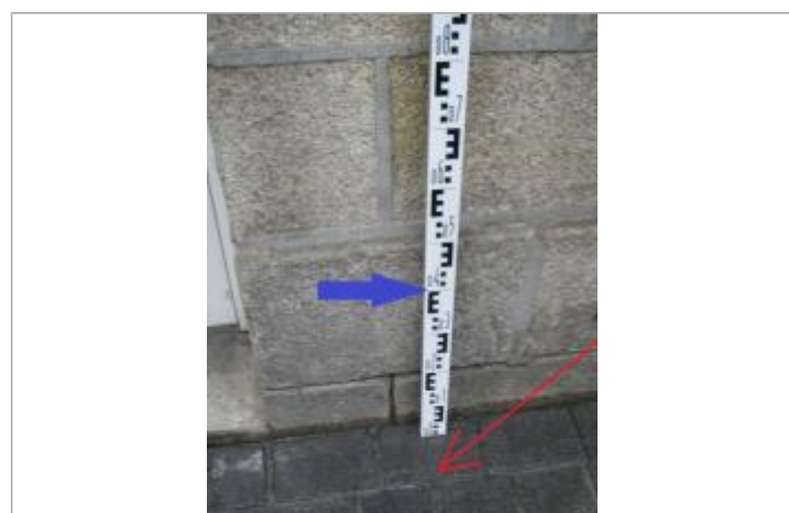
Trottoir à droite de la porte d'entrée - Photographie DHE 2015