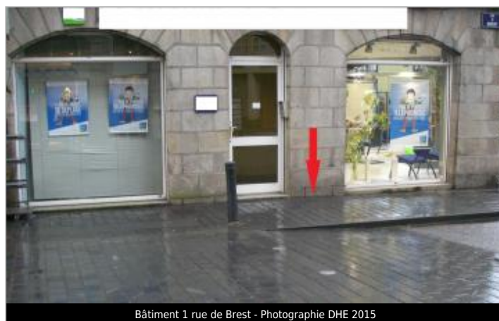
Bâtiment 1 rue de Brest