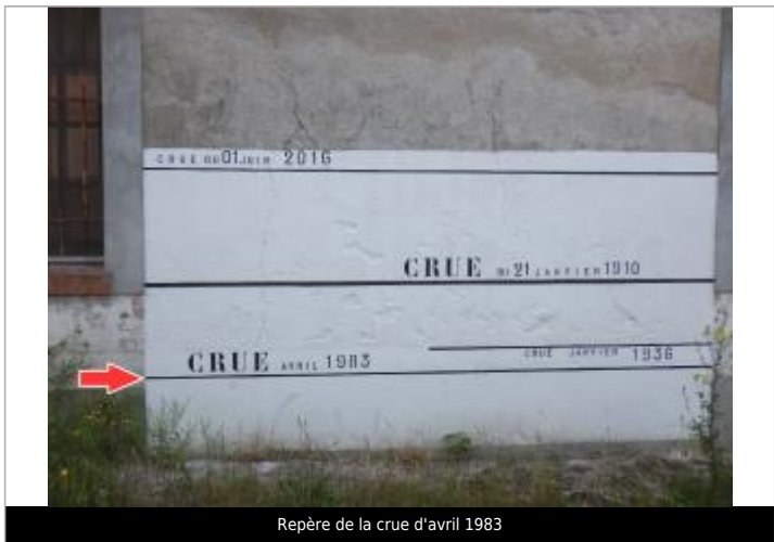
Repère de la crue d'avril 1983