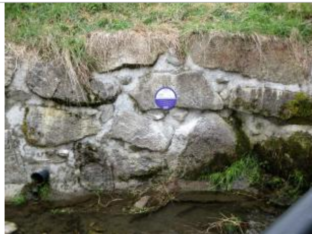
Site de Combloux