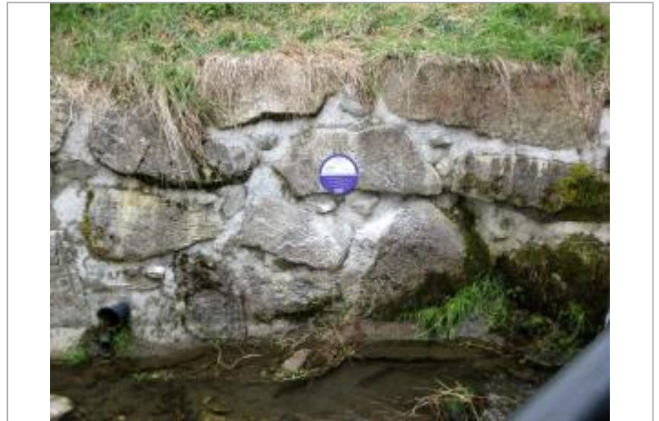
Site de Combloux