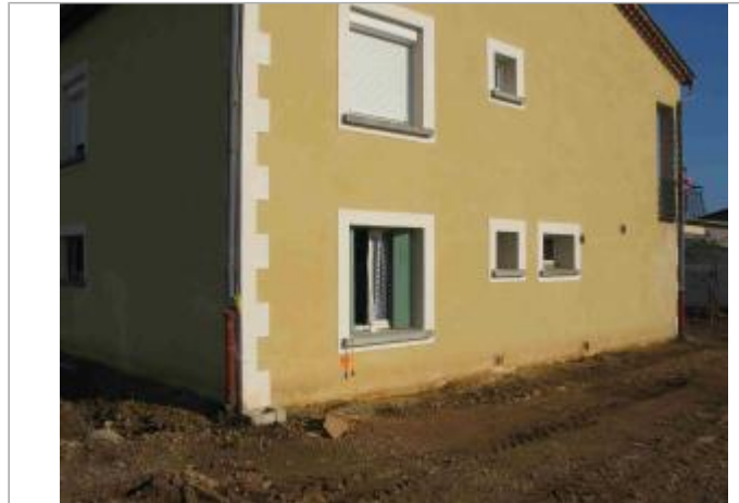
Vue du site - Auteur : Hydro Logik Ingénierie