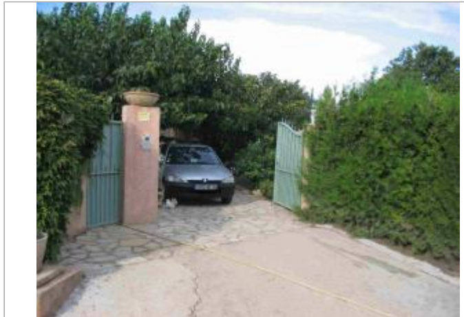
Vue du site - Auteur : Hydro Logik Ingénierie