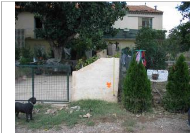
Vue du site - Auteur : Hydro Logik Ingénierie