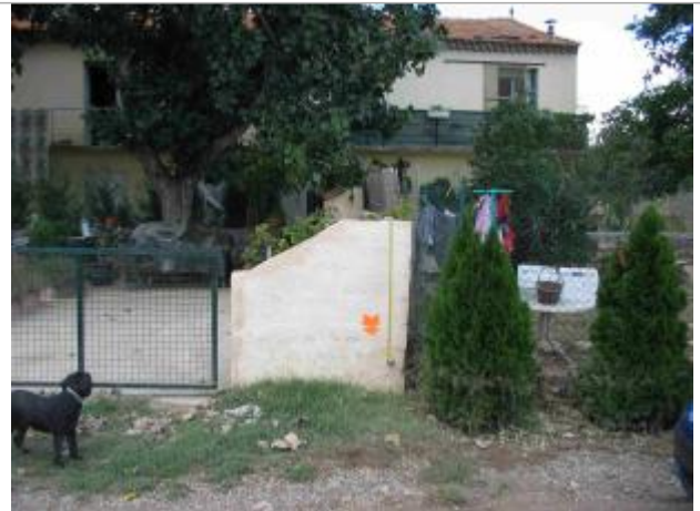
Vue du site - Auteur : Hydro Logik Ingénierie