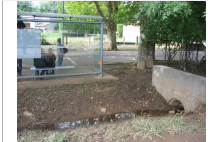
Vue du site - Auteur : Hydro Logik Ingénierie

Coordonnées WGS84 : X: 4.35181000 / Y: 43.78787700