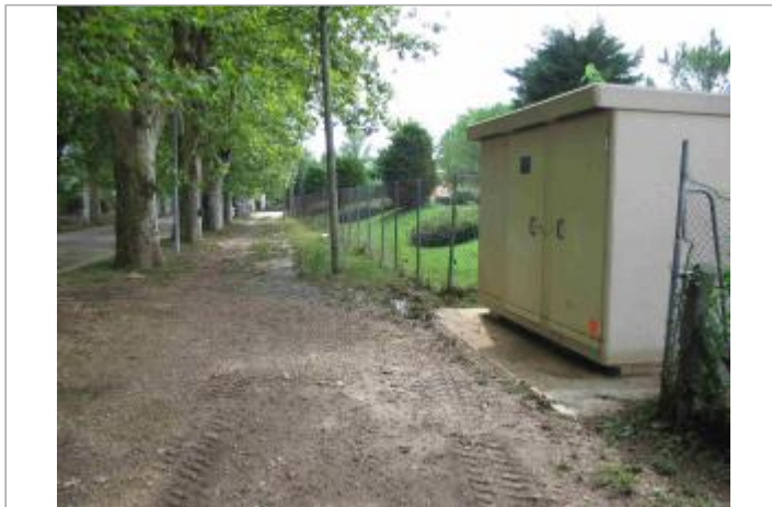
Vue du site - Auteur : Hydro Logik Ingénierie