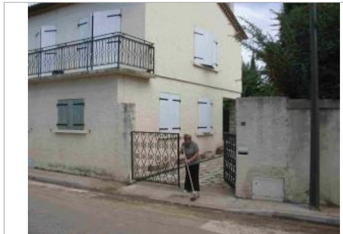
Vue du site - Auteur : Hydro Logik Ingénierie

Coordonnées WGS84 : X: 4.37975000 / Y: 43.79405200