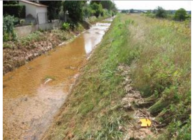
Vue du site - Auteur : Hydro Logik Ingénierie

Coordonnées WGS84 : X: 4.37275200 / Y: 43.79625100