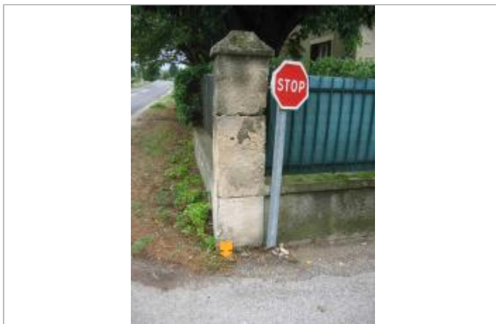
Vue du site - Auteur : Hydro Logik Ingénierie