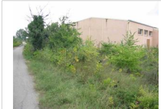
Vue du site - Auteur : Hydrologik Ingénierie