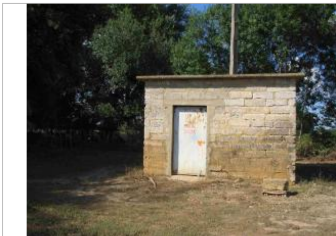
Vue du site - Auteur : Hydrologik Ingénierie

Coordonnées WGS84 : X: 4.25279800 / Y: 43.65445400