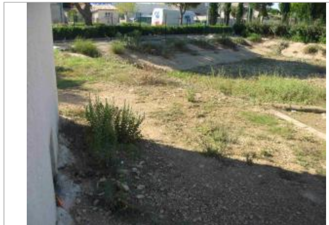
Vue du site - Auteur : Hydrologik Ingénierie

Coordonnées WGS84 : X: 4.26227200 / Y: 43.75302200