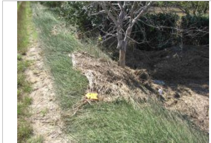
Vue du site - Auteur : Hydrologik Ingénierie

Coordonnées WGS84 : X: 4.26962100 / Y: 43.73254600