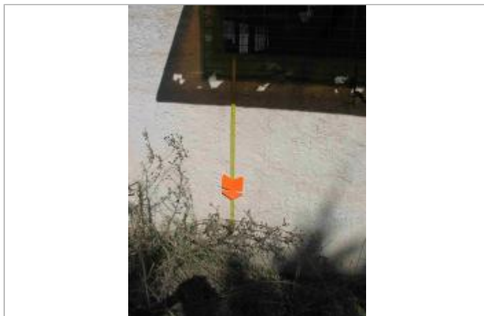
Vue du site - Auteur : Hydrologik Ingénierie