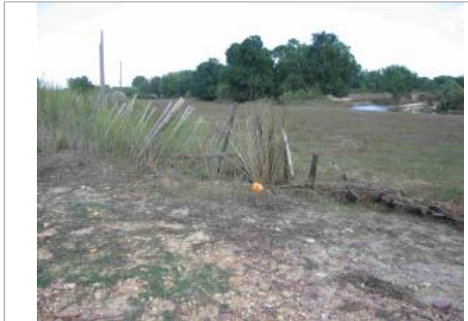
Vue du site - Auteur : Hydrologik Ingénierie

Coordonnées WGS84 : X: 4.26072200 / Y: 43.71809300