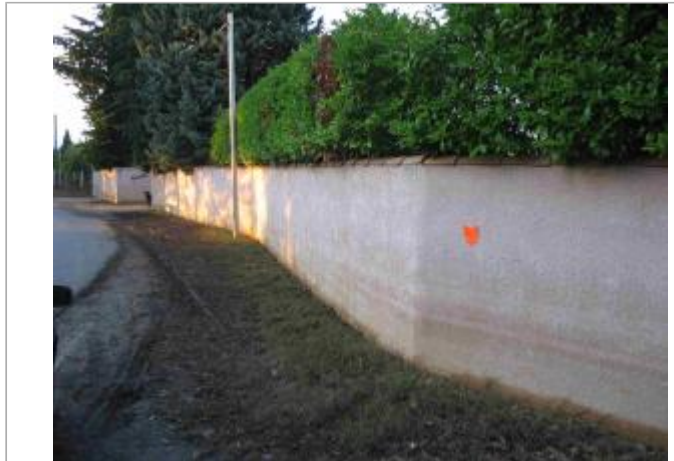
Vue du site - Auteur : Hydrologik Ingénierie

Coordonnées WGS84 : X: 4.29047200 / Y: 43.74879100