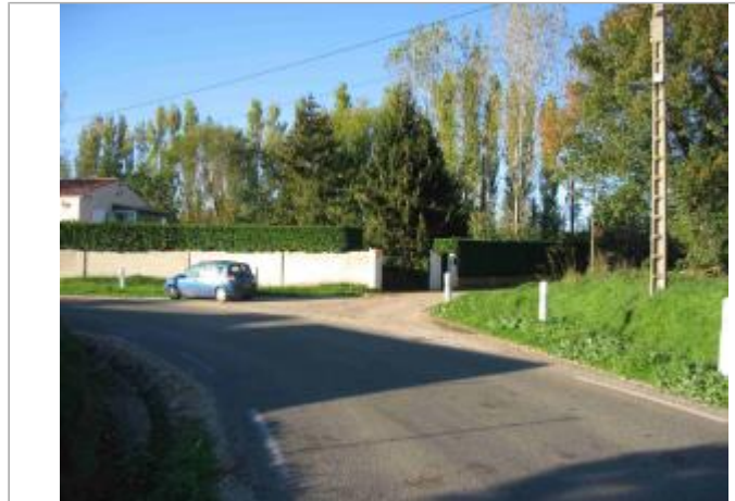
Vue du site - Auteur : Hydrologik Ingénierie

Coordonnées WGS84 : X: 4.30949200 / Y: 43.76175300