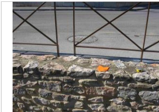
Vue du site - Auteur : Hydrologik Ingénierie

Coordonnées WGS84 : X: 4.28781200 / Y: 43.77142600