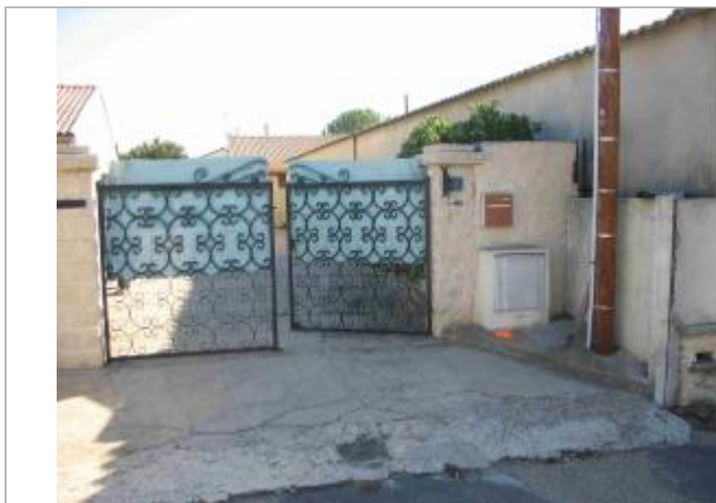
Vue du site - Auteur : Hydrologik Ingénierie

Coordonnées WGS84 : X: 4.28753600 / Y: 43.77178300