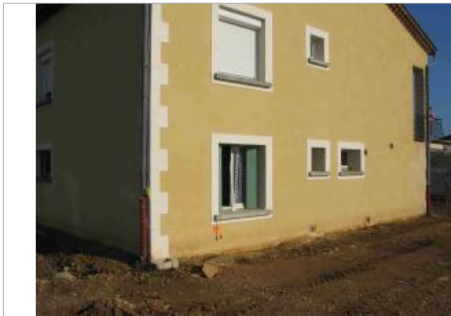
Vue du site - Auteur : Hydro Logik Ingénierie